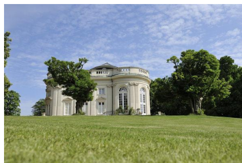
Schloss Richmond

Vorherige Anmeldung mit Bezahlung erforderlich: migration-bs@awo-bs.de Telefon: 0531 - 88 68 92 43