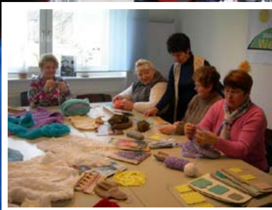
Handarbeiten-Gruppe Am Queckenberg